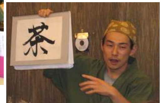
インストラクション