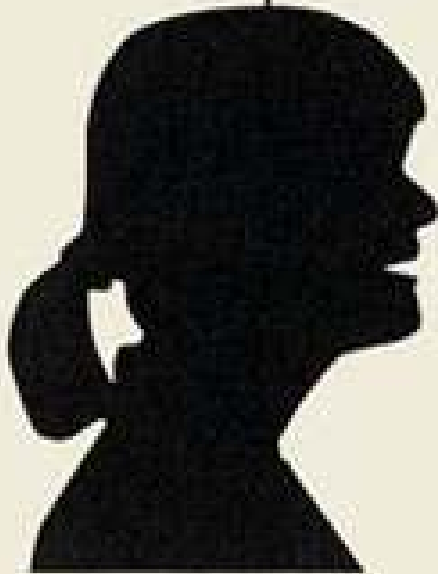
リーガロイヤルホテル子ちゃん

和東茶はハイクオリティだから、 まいとし全国三店舗で 「和東茶フェア」やっています。