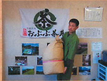
被災地(石巻など)に支援物資(茶葉30kg)を配送。