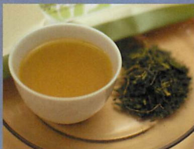
秋摘み茶葉100%のレアもの