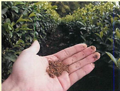
これが「なたね油の搾りかす」

まく肥料は、主に「なたね油の搾りかす」。 これを夏〜秋にかけて4回くらいに分けてまきます。 普通の農家さんの場合、2回くらいでまき終わるところをおぶぶの場合は4回にわけて、少しずつまくのがこだわりです。(分けてまくと雨が流