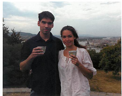
恋人と飲む日本茶は最高！！

非常に悲しいと残念なことです。ハンガリーは、大きな地震は起こったことがなく、小さな地震もめったに起こらないです。しかし初めに日本に行った時、ちょっとした地震を体験したことあったから、その恐怖感と不安がよく分かります。福島県に知り合いが住んでいるから、心配しましたが、皆さんは、無事で一安心しました。けれども原子炉がダメージを受けて放射の恐れもあり、心配でたまらないです。どうか出来るかぎり助けたいと思い、現在勤めている会社で寄付を回収して日本レッドクロスに送りました。日本茶なら、放射の心配は一番です。関西は、問題ないと分かってても信頼できない人もいます。その上に日本茶購入の税関手続きも厳しくなりました。幸いにおぶぶさんのお茶は、いまだに問題なく届いてきました。日本は、早く回復できるようにお祈りしています。