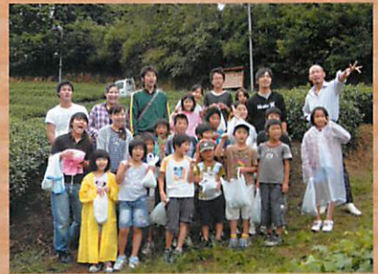
児童養護施設の子らに茶葉などを使った草木染め体験。

お金だけではできない、自分の手ごやる地道な活動。 これが「茶畑からの社会貢献」です。