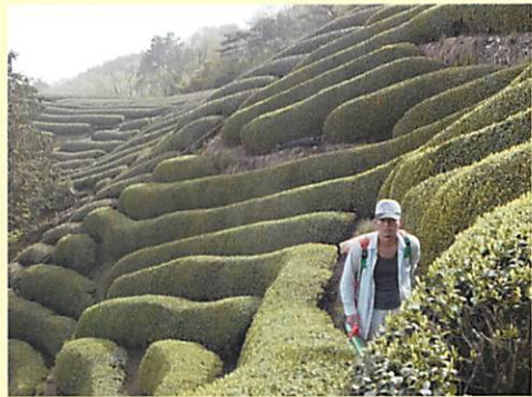
急勾配の畑での肥料やりはなかなかハード

実際の作業は、40kg位ある肥料袋を背負ってやります。まさに筋トレ。おぶぶの茶畑は13ヶ所に分かれているので、時間がかかります。肥料をまいて数日経つと、肥料は少しずつ分解されてゆきます。それを見ると茶の木が栄養さってるのでーって感じで嬉しくなります。