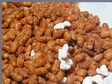
もち米の炒り玄米（ぶくぶくした形）

おぶぶ炒り玄米の原料は、国産「もち米」。ふつう、玄米茶の「炒り玄米」は、大半がうるち米（普通のご飯のお米）です。でももち米の炒り玄米のほうが香りが華やかで香ばしい感じがします。ここでマメ知識をひとつ。炒り玄米の原料の見分け方。玄米茶の茶葉を手に乗せ、炒り玄米を見ます。炒り玄米の表面がぶくぶくと膨れているなら、もち米が原料、米粒の原型をとどめていたら、うるち米が原料です。理由はもち米は炒った時におもちのように膨らむから。さあ次から玄米茶を飲むときは、茶葉も確かめてみよう！