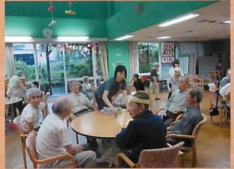
特養老人ホーム「金井原苑」でお茶を飲んでいただきました。