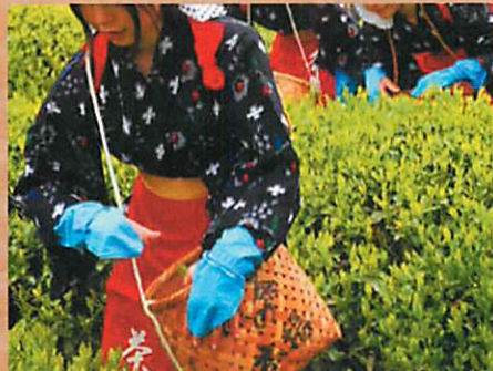
茶娘衣装で茶摘みに夢中の児童自立支援施設の女生徒さん。