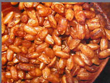
うるち米の炒り玄米（米つぶの形）