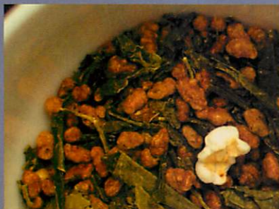
お月見茶葉に玄米を同じ重量まぜる

抽出は、「お月見煎茶」と同じく100℃の熱湯を五秒抽出。すると不思議。超さわやかな玄米茶のでき上がり。ぜひお試しあれ。