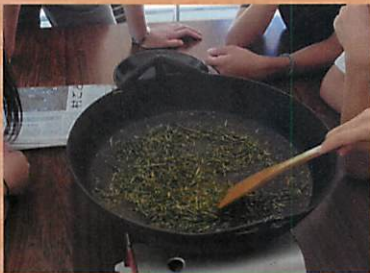
京都府内の児童養護施設に住む高校生の交流イベントの最終日にほうじ茶の焙煎体験。